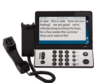
Hamilton CapTel 2400i Phone

Ampliar tus opciones para recibir subtítulos a través del proveedor de servicios de Relay Connecticut, Hamilton Relay.